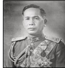
Field Marshal Phibulsongkram

(a) Mengapakah perkembangan gerakan nasionalisme di Thailand dianggap berbeza daripada negara-negara lain di Asia Tenggara?