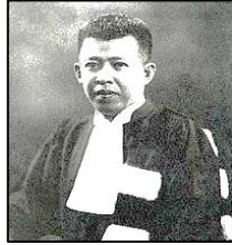
Nai Pridi Phanomyong

1 Gambar berikut menunjukkan tokoh nasionalis yang telah membawa perkembangan nasionalisme di Thailand.